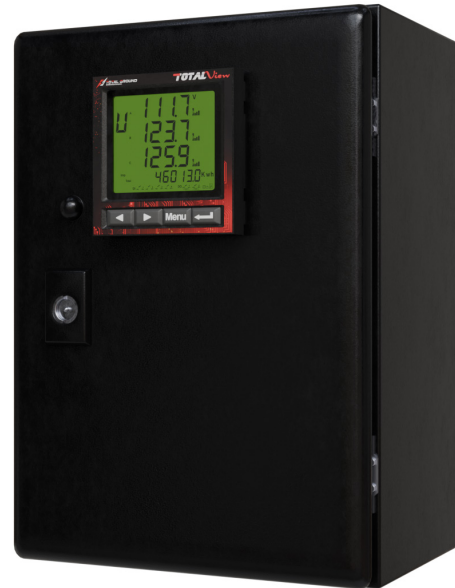
Las imágenes son exclusivamente de carácter ilustrativo y están sujetas a modificaciones.

Conexión tipo estrella, donde cada nodo se comunica directamente con la estación base, lo cual permite que los dispositivos finales sean lo más simples y sencillos.