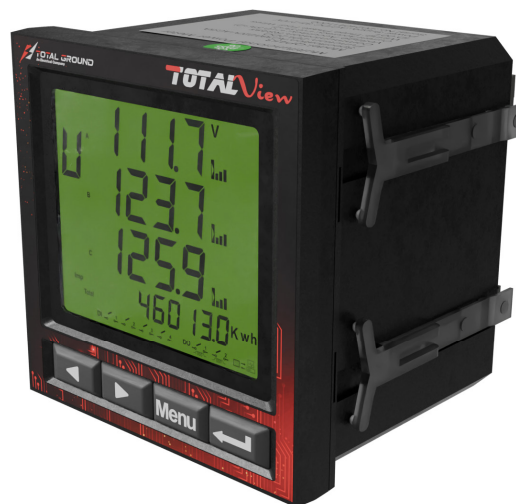
Las imágenes son exclusivamente de carácter ilustrativo y están sujetas a modificaciones.

Conexión tipo estrella, donde cada nodo se comunica directamente con la estación base, lo cual permite que los dispositivos finales sean lo más simples y sencillos.