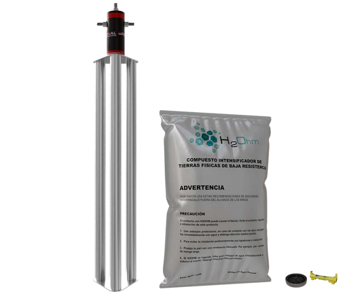
Las imágenes son exclusivamente de carácter ilustrativo y están sujetas a modificaciones.