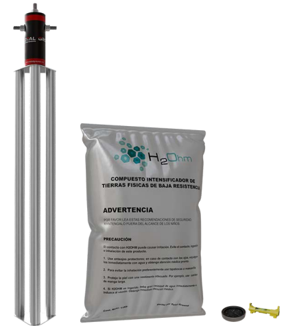
Las imágenes son exclusivamente de carácter ilustrativo y están sujetas a modificaciones.