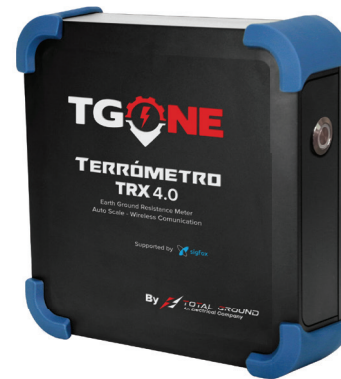
Las imágenes son exclusivamente de carácter ilustrativo y están sujetas a modificaciones.

*TGONE Pro incluye el manejo de mas equipos de las líneas de producto de Total Ground; para mayor información consulte a su ejecutivo de cuenta.