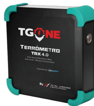
Las imágenes son exclusivamente de carácter ilustrativo y están sujetas a modificaciones.